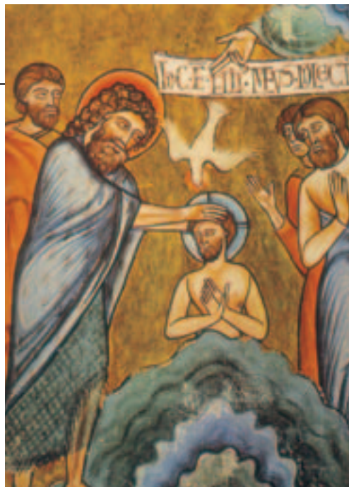
Il Battesimo di Gesù (Miniatura tedesca del XII secolo). Giovanni Battista impone le mani, mentre Dio dall'alto invia lo Spirito sotto forma di colomba. In basso: La visita di Maria a Elisabetta (olio su tela di Francesco De Mura).

L'ultima voce dello Spirito Santo è Giovanni Battista. Di lui il Vangelo dice: «è pieno di Spirito Santo fin dal seno di sua madre» (Lc 1,15). Anche Elisabetta è «piena di Spirito Santo» quando saluta la Vergine Maria con le parole: «Benedetta tu fra le donne... beata colei che ha creduto nell'adempimento