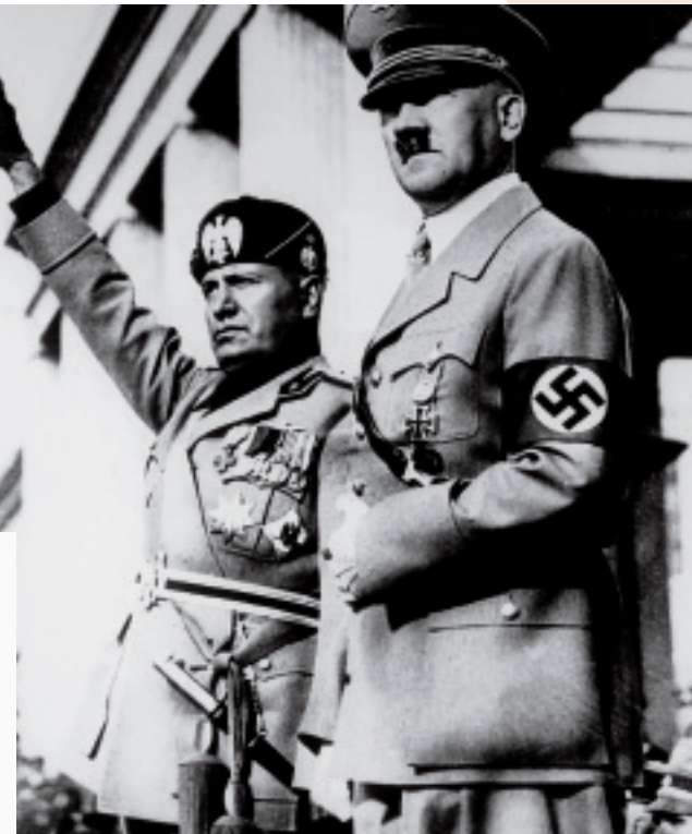
A FAVORE E CONTRO LA GUERRA IN EUROPA A sinistra Pio XII e il presidente americano Roosevelt, impegnati a mantenere la pace. Sopra Hitler e Mussolini. Il capo dei nazisti non ebbe esitazioni nel preparare la guerra contro le democrazie del Vecchio Continente

cause della reciproca diffidenza, tentino di risolvere le attuali divergenze con l'unico mezzo a ciò adatto, cioè con comuni e leali intese; a questi, perché, nella calma e nella serenità, senza incomposte agitazioni, incoraggino i tentativi pacifici di chi li governa». Papa Pacelli introduce poi nel suo discorso un'affermazione molto diretta: «È con la