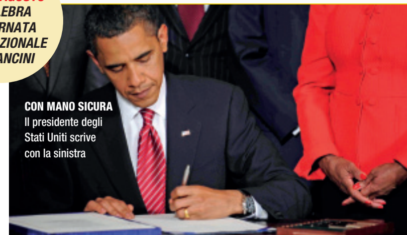
CON MANO SICURA Il presidente degli Stati Uniti scrive con la sinistra

difficoltà superabili senza particolari sforzi, ma nei casi in cui la cosa riesca difficile, sono ormai diffusi i negozi in grado di fornire oggetti "speculari". Tra gli specializzati, il più celebre è Anything Left Handed , aperto a Londra quarant'anni fa e che ora vende anche su Internet articoli per mancini. Sulla Rete si possono trovare in vendita oggetti per mancini anche in siti commerciali non specializzati, come www.nutsworld.net/mondo-mancino.php . In mancanza di oggetti "sinistri", si può sempre fare ricorso allo spirito di adattamento dei "maldestri".